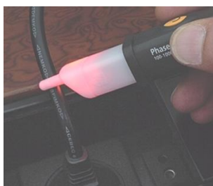
Rilevazione tensione AC