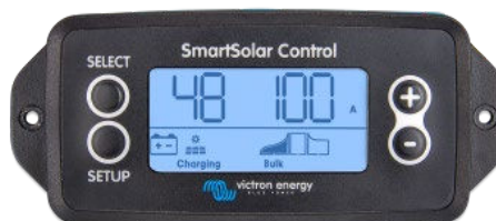
Display a spina SmartSolar