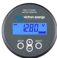
Rilevamento Bluetooth: Dispositivo di controllo della batteria Smart BMV-712