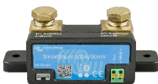
Rilevamento Bluetooth: SmartShunt