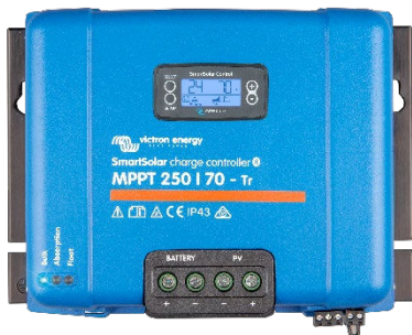
Regolatori di carica SmartSolar MPPT 250/70-Tr con display a spina opzionale