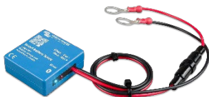
Rilevamento Bluetooth: Rilevatore Smart Battery