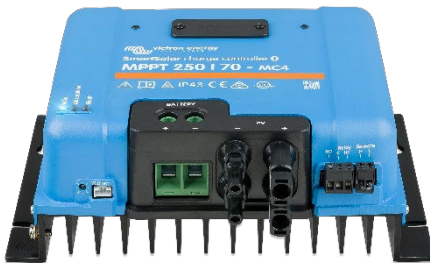
Regolatori di carica SmartSolar MPPT 250/70-MC4 senza display